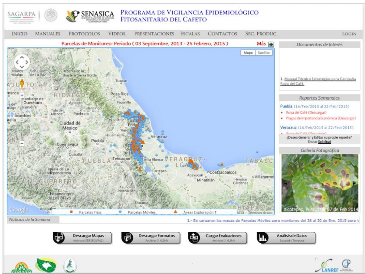
Figura donde se observa las actividades realizadas dentro de la campaña en el Estado de Veracruz.

En este mes de Mayo se monitorearon aproximadamente 680 has. del cultivo de café en las cuales se detectaron afectaciones por Roya del cafeto.